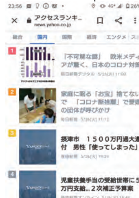
◀2020年5月26日、Yahoo ニュースランキングで2位となった愛媛資料ネットの記事