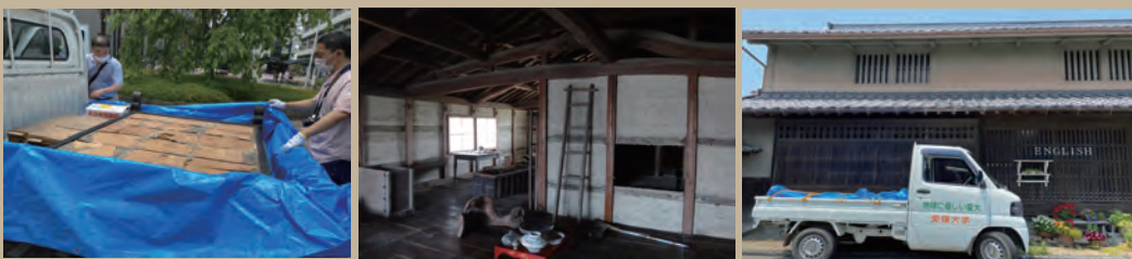
▲愛媛大学へ資料を搬送 ▲GWにコロナ断捨離した屋根裏 ▲松前町の旧家

愛媛資料ネットの活動 二〇〇一年三月の芸予地震を機に、伊予史談会と愛媛大学が設立した愛媛資料ネットは、愛媛大学法文学部日本史研究室に事務局を置き、二〇〇四年や二〇一八年の豪雨などで被災した愛媛県内の資料を救出してきました。日常的にも資料に関わる相談を受け付けています。