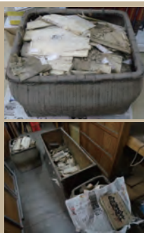
▲2004年土石流被害にあった新居浜市内の旧庄屋に残っていた多喜浜塩田の経営史料

埃をかぶり、読めない文字で書いてあるものよくわからない紙束…大切な歴史資料かも知れません！私達の今までの活動で扱った資料を連載で紹介いたします。お心当たりのある方は、お手元の品を一旦捨てずに、愛媛資料ネットまでご相談ください。（佐々木紫帆）