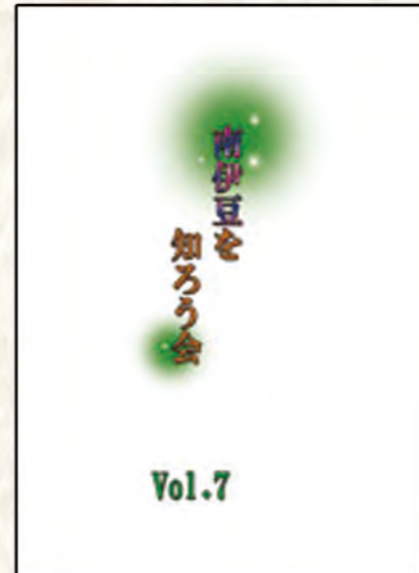
報告書『南伊豆を知ろう会』