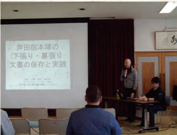
活動の説明と史料の紹介