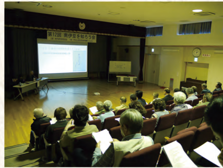
南伊豆を知ろう会の様子